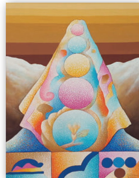
"La majella Madre", Luigi Baldacci (2005, acrilico su tela, 50x70)